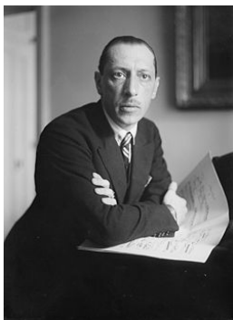
Igor Stravinsky (1882-1971)

Trois musiciens d'exception vont marquer le 20 ème siècle naissant sans chercher à faire table rase du passé.