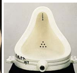
Marcel Duchamp : Fontaine (1917)

La frontière qui sépare l'aventure de l'imposture est parfois si ténue qu'il n'est pas toujours facile de s'y retrouver, particulièrement lorsqu'une spéculation marchande perturbe la mise en place d'une échelle des valeurs.