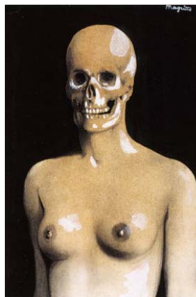
René Magritte : La Gâcheuse (1935)