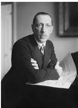
Igor Stravinsky (1882-1971)

Trois musiciens d'exception ont marqué le 20 ème siècle naissant sans chercher à faire table rase du passé.