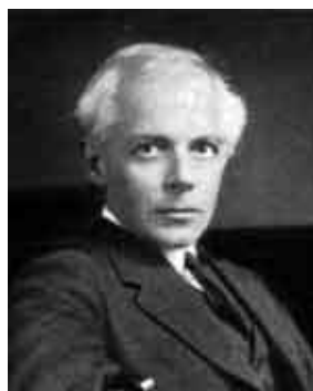
Bela Bartok (1881-1945)