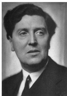
Alban Berg (1885-1935)