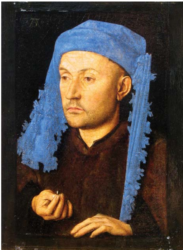
Jan Van Eyck : L'homme au chapeau bleu (1430)

Voici deux tableaux de peintres primitifs flamands qui illustrent cette définition. Contrairement à ce qui se passe avec la terne Joconde que les photographes retouchent abusivement, histoire d'entretenir sa légende, les images reproduites ci-dessous ne donnent qu'une pâle idée de la splendeur des originaux. Les poils de barbe du personnage de Van Eyck sont peints un à un avec un réalisme saisissant et la couleur bleue de sa coiffe a conservé, après 600 ans, une intensité impossible à décrire. En comparaison, les églises baroques sont pleines de scènes d'inspiration biblique aux couleurs carbonées qui font peine à voir : il faudrait des restaurations infinies pour leur redonner un minimum d'éclat, ce qui ne les rendrait pas beaucoup plus stimulantes pour la cause. La transparence de la coiffe de la dame peinte par Van der Weyden est un autre exemple de défi parfaitement relevé.