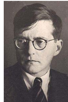
Dimitri Schostakovitch (1906-1975)

En 1913, à Paris, Igor Stravinsky a révolutionné la notion de rythme avec son "Sacre du Printemps". Il a confirmé en 1917, en enchaînant deux chefs-d'œuvre : "Le Chant du