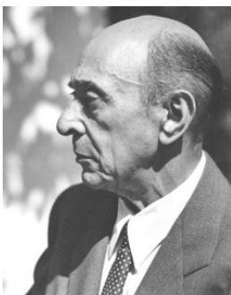
Arnold Schönberg (1874-1951)

Pour rappel, on regroupe sous l'appellation, "Première Ecole de Vienne" les trois classiques, Haydn, Mozart et Beethoven.