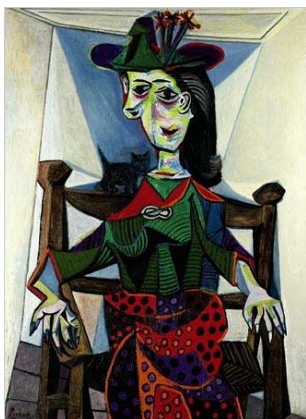
Pablo Picasso : Dora Maar au chat (1941)

En matière d'Arts Plastiques, le 20 ème siècle fut celui de toutes les audaces et de toutes les expérimentations, réussies ou pas, bref de toutes les aventures mais aussi de toutes les impostures. Il a permis l'éclosion de mouvements artistiques aussi variés que le futurisme, le constructivisme, le cubisme, l'abstraction, le surréalisme, le pop art, etc. ..., sans oublier le provocateur Dada. Cette profusion de courants a créé son lot de confusions. Qui hésiterait sérieusement entre se déplacer pour assister à une rétrospective Picasso, Bacon ou Magritte ou visiter une exposition de la vingtaine d'urinoirs « signés » Duchamp, pourtant très sérieusement exposés, à grands frais, dans les plus grands musées du monde ?