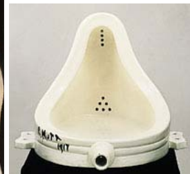
Marcel Duchamp : Fontaine (1917)

La frontière qui sépare l'aventure de l'imposture est parfois si ténue qu'il n'est pas toujours facile de s'y retrouver, particulièrement lorsqu'une spéculation marchande perturbe la mise en place d'une échelle des valeurs.