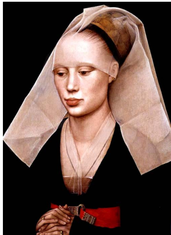
Rogier Van der Weyden : Portrait de femme (1455)

Cette définition vaut ce qu'elle vaut et ne prétend certainement pas être parfaite. L'intervention humaine est certainement requise - on ne va tout de même pas exposer un caillou dans un musée, aussi harmonieux soit-il - par contre, il n'est pas évident que l'on puisse se passer du critère technique ou esthétique. De plus, cette définition ignore la notion de prise de risques qui différencie l'auteur innovant de celui se contentant de reproduire à l'identique des recettes ayant fait leurs preuves.