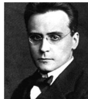
Anton Webern (1883-1945)

La "Seconde Ecole de Vienne" comprend Schönberg et ses élèves, Berg et Webern. Chacun a pratiqué la technique dodécaphonique à sa manière :